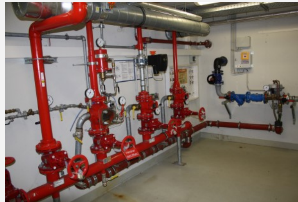
Sprinklerzentrale mit mehreren Alarmventilstationen